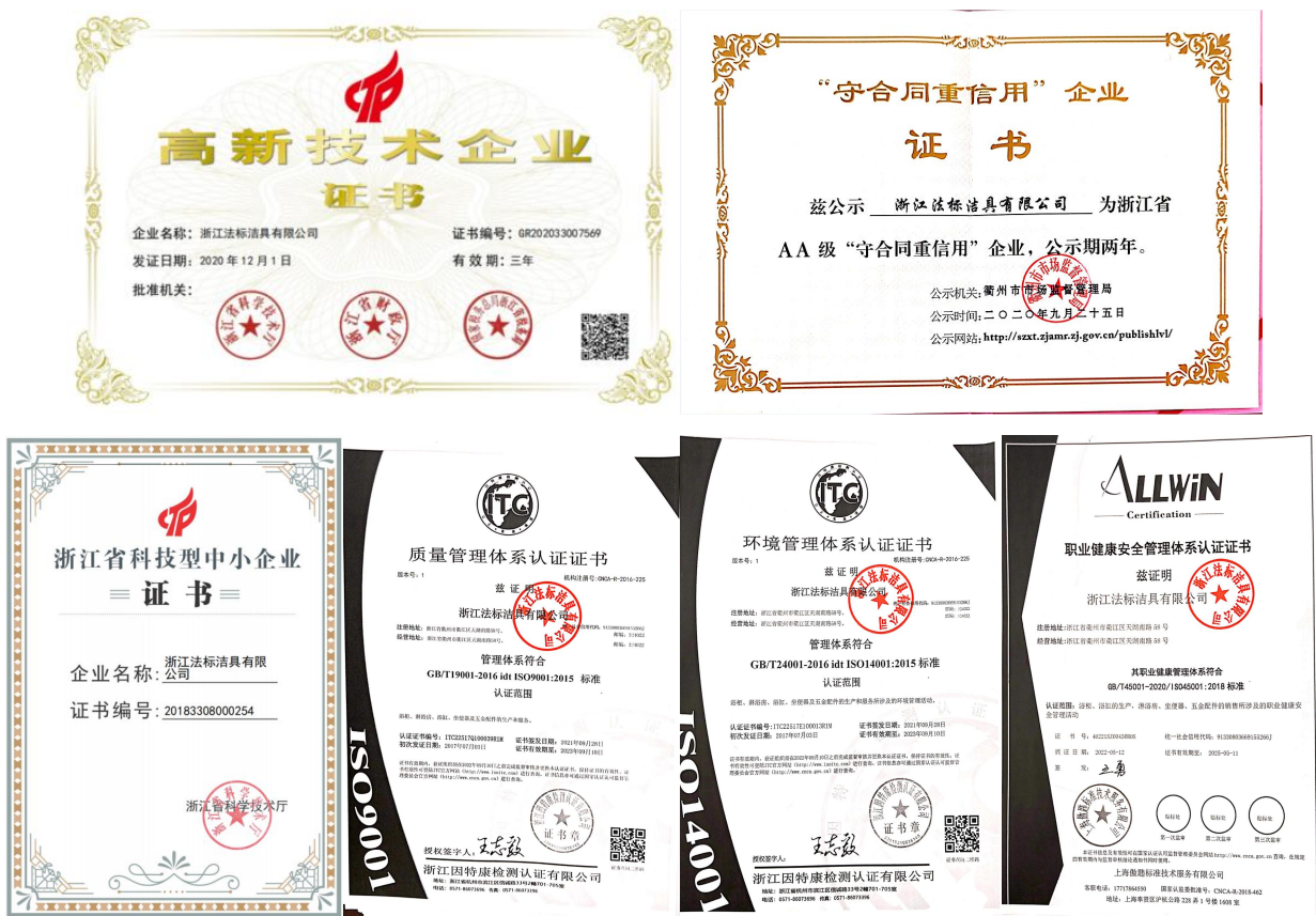
图 1-1 公司荣誉展示

法标洁具站在“洁具家居化”的高度做洁具，法标洁具在产品结构不断完善和细化。以“人性、简洁、时尚、实用”为产品开发理念，在色彩、性能、配套等方面不断的创新，得到了广大消费者的高度认可，06年被评为“中国著名品牌”，获得“中国洁具行业 20 质量过硬放心品牌”、“国家权威检测·质量合格产品”等殊荣，并获得多项产品专利。法标洁具的中外优秀设计师团队凭借强大的研发能力全新研发打造，形成新古典、简欧、仿古、现代、后现代等多种风格的洁具产品，给洁具赋予家居的灵魂。现拥有法兰西系列、戴高乐系列、8000 系列、9000 系列、600 系列、500 系列、2008 系列及 009 系列等系列浴室柜；浴缸有东方丽人、路易、老爷车、亚瑟王、安冬妮等各系列的功能缸、冲浪缸、动力缸；淋浴房有各种款式、各种型号的整体房、蒸汽房、简易房；有各种型号坐便、智能坐便；三十多款花洒及上百款五金配件。“法标”正是完美的产品品质及贴心的售后服务，而成为行业新的风向标。