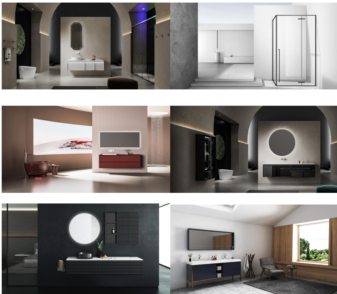
图 1-2 公司产品风格展示

目前公司主要产品线包括法兰西系列、戴高乐系列、8000 系列、9000 系列、600 系列、500 系列、2008 系列及 009 系列等系列浴室柜；浴缸有东方丽人、路易、老爷车、亚瑟王、安冬妮等各系列的功能缸、冲浪缸、动力缸；淋浴房有各种款式、各种型号的整体房、蒸汽房、简易房；有各种型号坐便、智能坐便；三十多款花洒及上百款五金配件。在浙江省内属于营销服务一体化企业，产品市场占有率名列全省靠前。